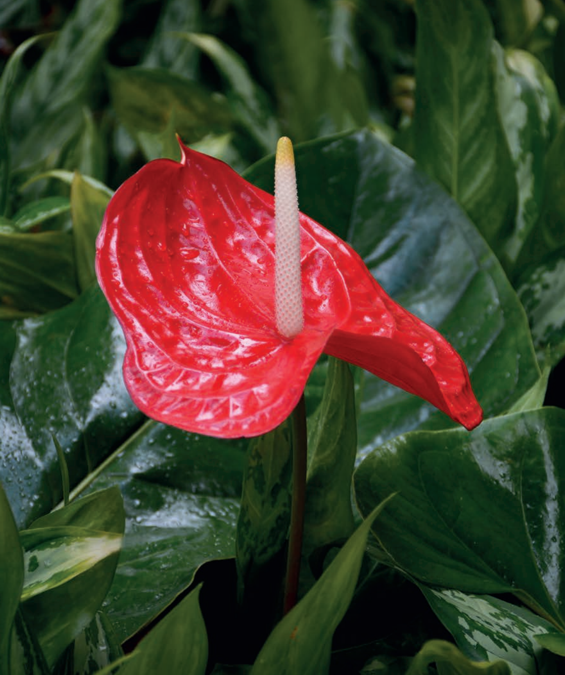
Anthurium Fire ®